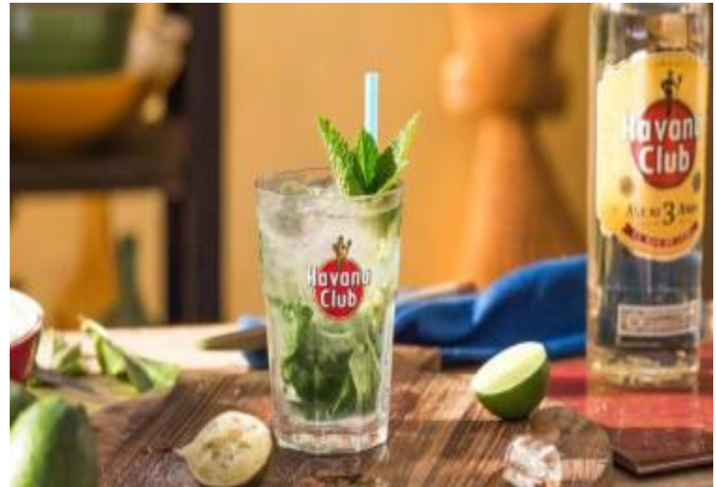
Le célèbre mojito...