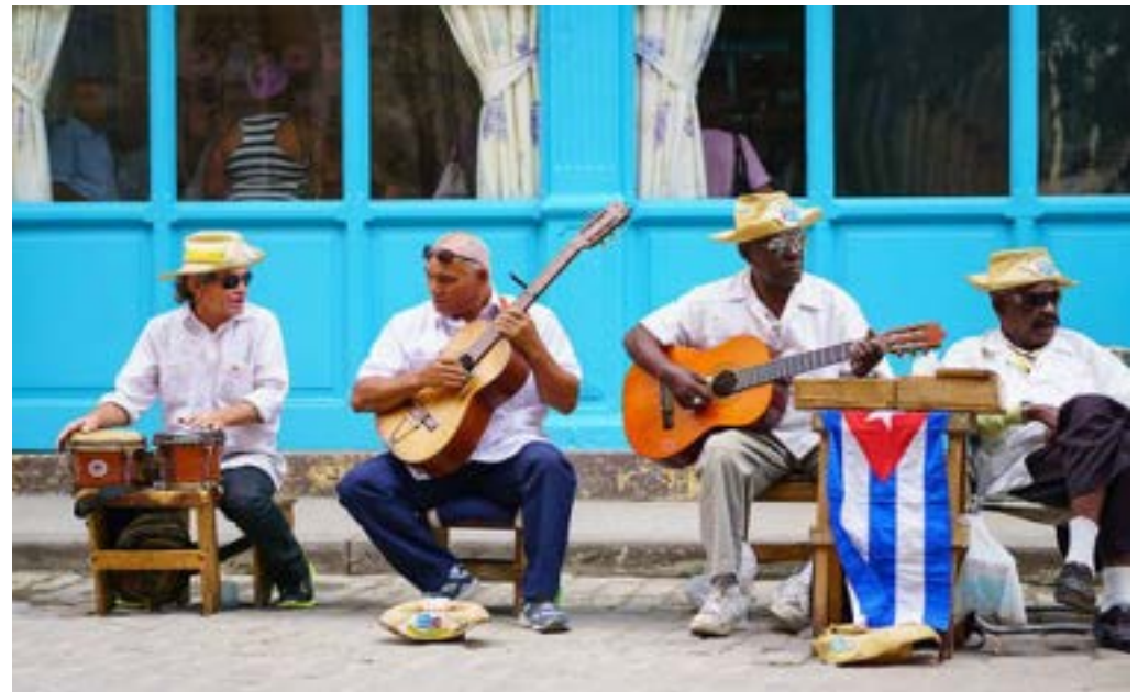
Un air de musique à chaque coin de rue...