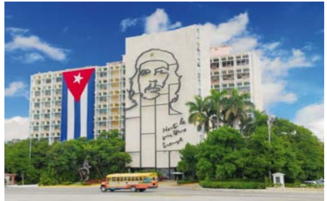
La place de la Révolution