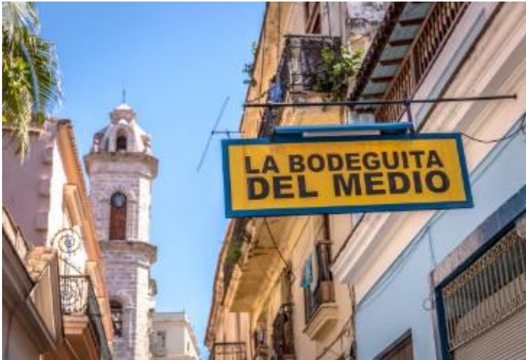
L'incontournable Bodeguita del Medio