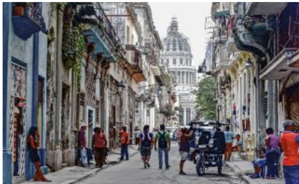
Les rues animées : Obispo, San Ignacio; Obapria et Oficios