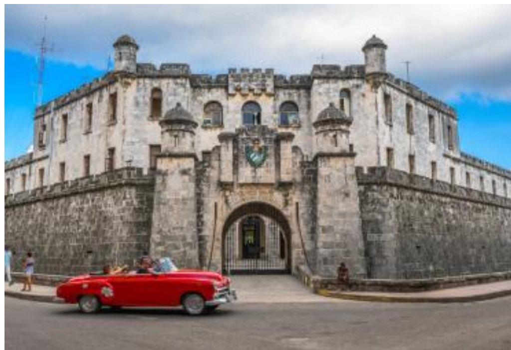
Le Castillo de la Real Fuerza : forteresse la plus ancienne de la ville