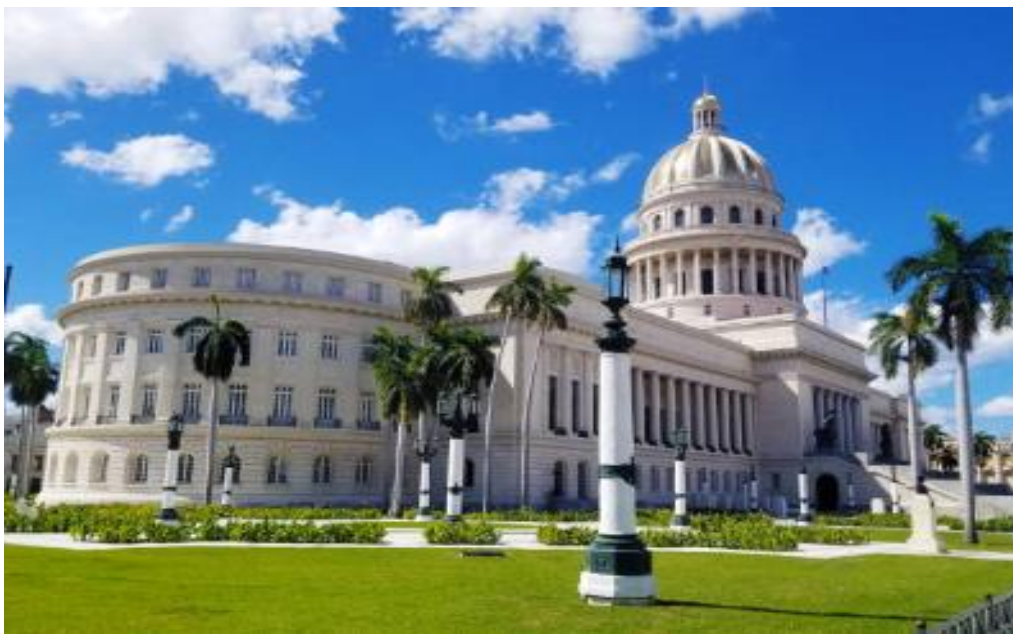
Le célèbre Capitolio : identique à celui de Washington