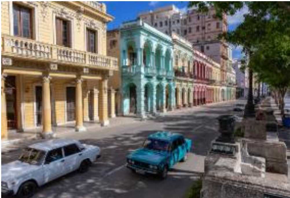
Le quartier du Velado et ses maisons pleines de charme