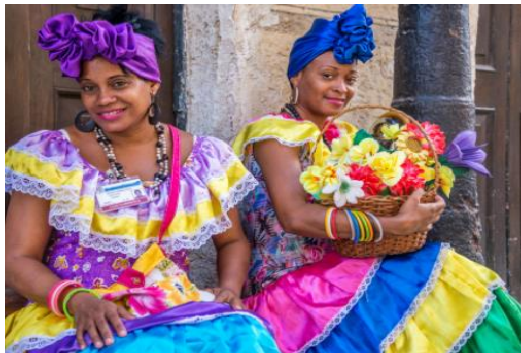
Cubaines avec leur magnifique costume traditionnel haut en couleurs