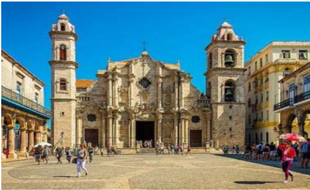
La jolie Place de la Cathédrale San Cristóbal, joyau de l'architecture coloniale cubaine.