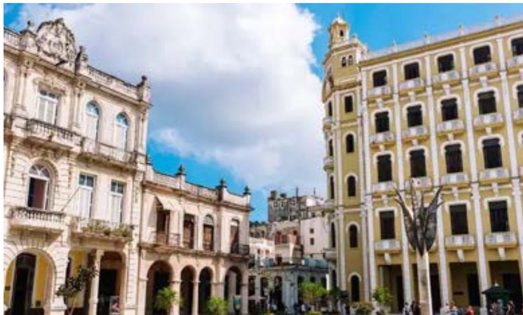
La Plaza Vieja