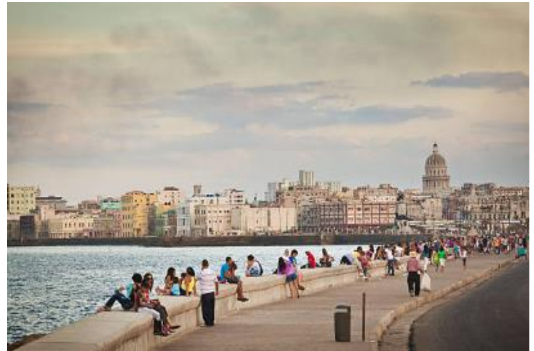
La longue promenade du Malecon